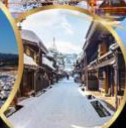
ทาคายาม่า