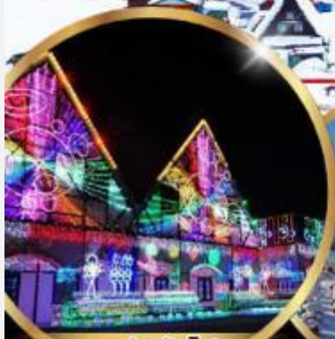
งานประดับไฟ Tokyo german village